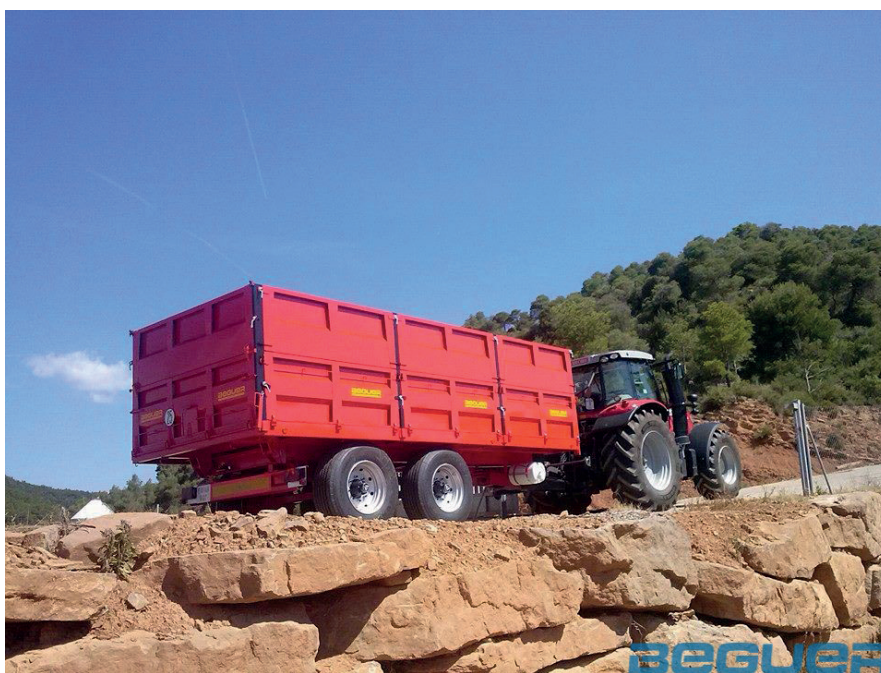
Algunas características pueden no coincidir con la imagen